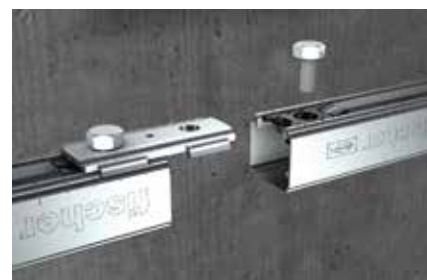
Connessione tra profili FLS mediante SV 31