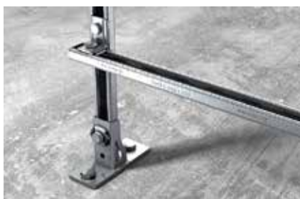
Profili fissati a pavimento