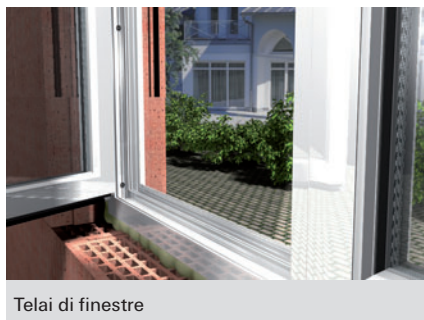
Telai di finestre