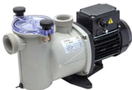
Bocchettoni non inclusi

Pompe centrifughe autoaspiranti KRIPSOL, serie NINFA. Corpo in materiale termoplastico stampato. Girante in Noryl con fibra di vetro. Cestello del pre-filtro in materiale plastico stampato di colore bianco. Tappo del prefiltro in policarbonato trasparente con sistema di apertura e chiusura tramite viti in AISI 304 a manopole e o-ring. È possibile utilizzare questa pompa con acqua di mare.