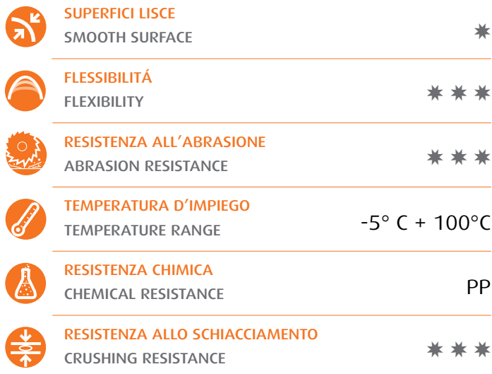
Tubo in PP PP hose

Blow moulded corrugated hose in polypropylene for light suction of dusts and fumes in industry.