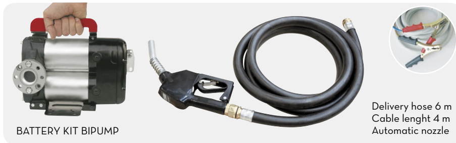
BATTERY KIT BIPUMP

Delivery hose 6 m Cable lenght 4 m Automatic nozzle