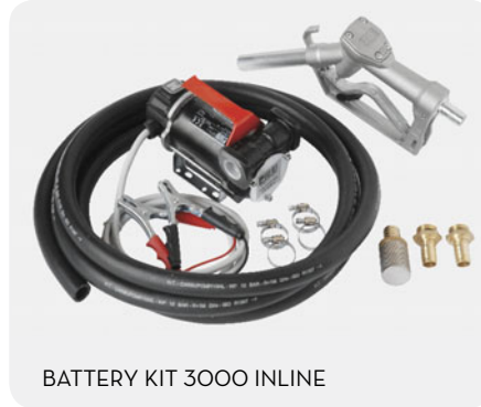
BATTERY KIT 3000 INLINE