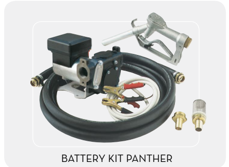
BATTERY KIT PANTHER