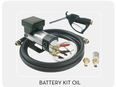
BATTERY KIT OIL