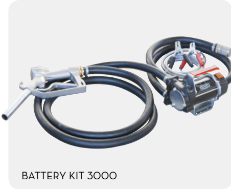
BATTERY KIT 3000