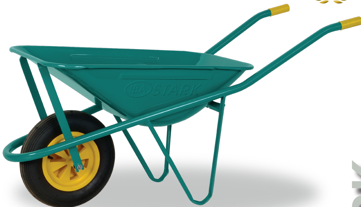
STARK BASE STARK STANDARD