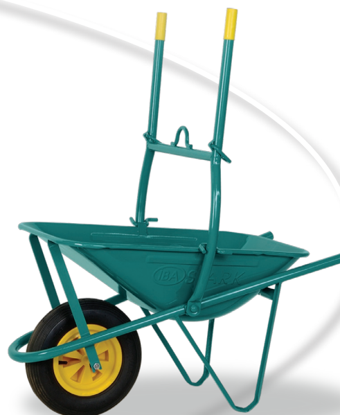
STARK SOLLEVABILE STARK LIFTABLE

All our Liftable wheelbarrows are in accordance with Community directives and be accompanied by an user manual.