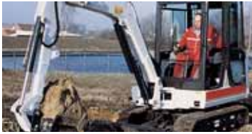
Per impiego professionale