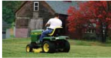
Per il fai da te