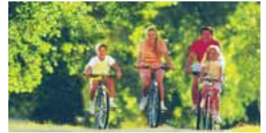
Per il tempo libero